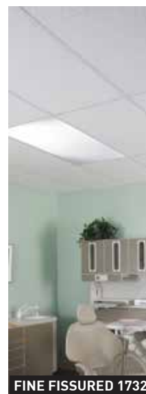
FINE FISSURED 1732